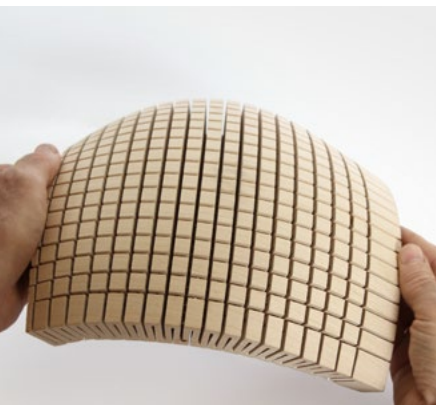
massive lime wood