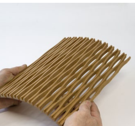
FOLI2, MDF nature 10mm